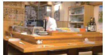
鮎・和食 真 飲食店 tel.096-323-3216 熊本市中央区下通1-5-10 2F