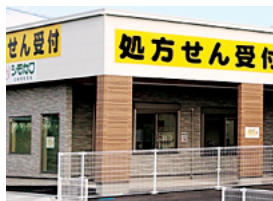
シモカワ広島調剤薬局 調剤薬局 tel.096-288-7505 上益城郡益城町広崎1572-2