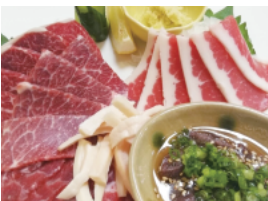
さくら食堂 飲食店 tel.080-3988-6147 熊本市中央区下通1-6-4武蔵ビル2F