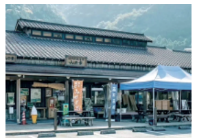
道の駅 子守唄の里五木 物産館 tel.0966-37-2301 球磨郡五木村甲2672-54