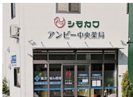
シモカワアンビー中央薬局 調剤薬局 tel.096-247-2510 合志市竹辺2292